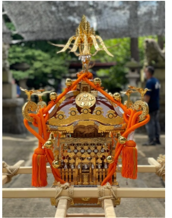
【新調した子ども神輿】