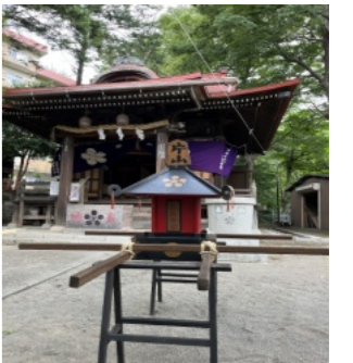
【以前の子ども神輿】